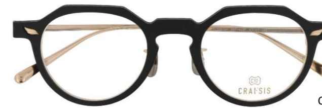
CRF-503F チタン・PA11/βチタン 47□22-145(B:40.2)