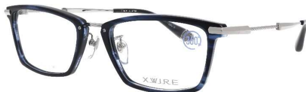
COL.2 ネイビーササ／IPシルバー