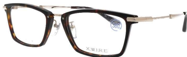
COL.1 ブラウンデミ／ホワイトゴールド