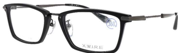
COL.3 ブラック／IPガンメタル