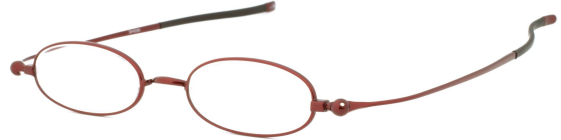
Col.2 ダークワインマツ