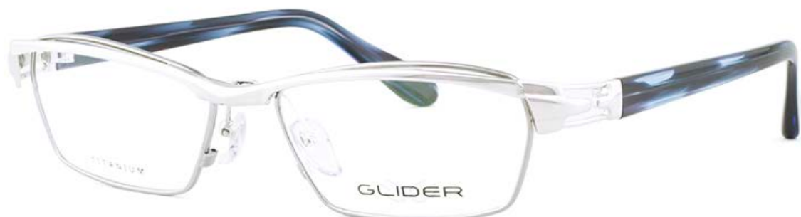
1 シルバー/ブルーササ