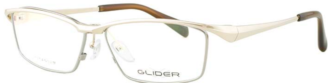
1 ホワイトゴールド