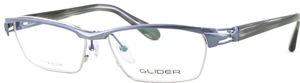
2 ダークネイビー/グレーササ