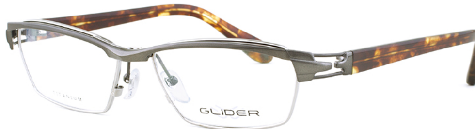
3 ガンメタル/ブラウンデミ