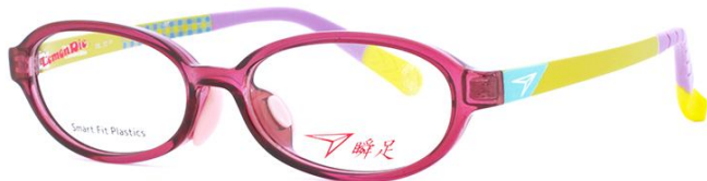
22 クリアダークピンク／イエロー