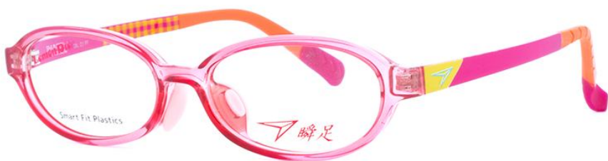
21 クリアライトピンク／ピンク