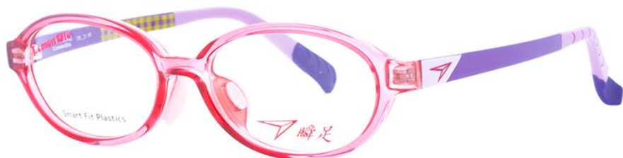
21 クリアライトピンク／パープル