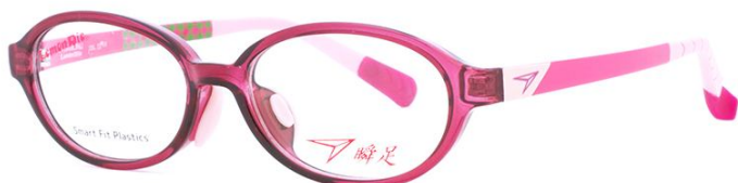
22 クリアダークピンク／ピンク